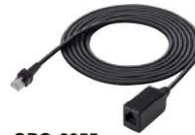
OPC-2355 Länge: 2,5 m